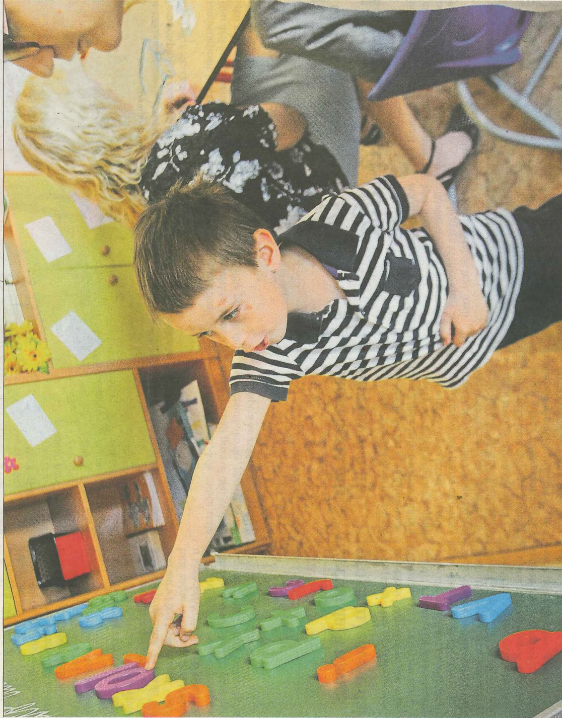
Poprvé před tabulí Na 150 dětí dorazilo v sobotu do 1. ZŠ v Plzni. Uskutečnil se tam totiž zápis do prvních tříd. Zhruba dalších dvacet budoucích prvňáků škola očekává ve druhém termínu, který připadá na dnešek.

Rodiče se nemusejí obávat, že by pro jejich děti nebyl ve škole dostatek míst. „Všech 1800 dětí umístíme, máme prověřené kapacity. Jen se může stát, že rodiče nedostanou dítě do té vybrané, pro ně vysněné školy. U některých škol možná může být převis dětí, které přijdou k zápisu, ale v rámci spádového obvodu je do prvních tříd vždy umístíme,“ ujistila vedoucí odboru školství plzeňského magistrátu Dagmar Škubalová. V celém Plzeňském kraji nastoupí v září do prvních tříd na 6300 dětí, což je zhruba stejný počet jako loni. – Petra Petříková